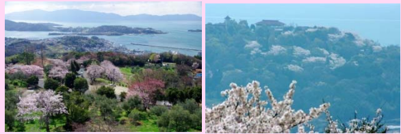
展望台からの景色です。奥に見えるのは前島の桜です。