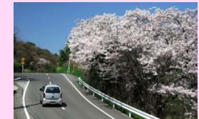
オリーブ園に来る途中(師楽峠の頂上付近、 地図中の★)にある桜。昭和天皇の 行幸記念に植樹されたものようです。