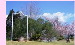
背景に桜がくるように撮影を工夫してみてください。