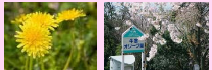
足元に広がるタンポポのじゅうたんが春を感じさせます。 ここで記念撮影されている方をよくお見かけします。