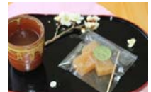
3/30～4/6の期間限定セットです。 ¥300。テイクアウトできます。