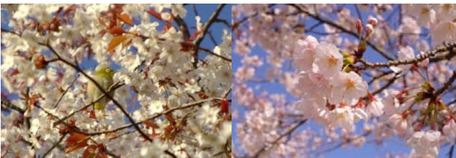
ヤマザクラは花が咲き、同時に葉も出ています。ソメイヨシノは花が咲き終わった後に葉が出てきます。