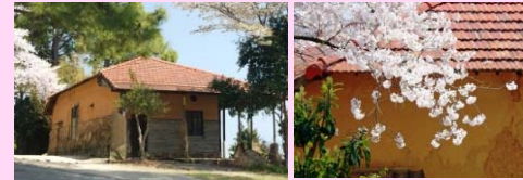
画家の佐竹徳先生がアトリエとして使っていた「赤屋根」。 屋根と桜のコントラストがきれいです。