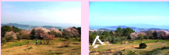
山頂芝生広場から角度が少し違うだけでも色々な景色が楽しめます。