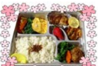
瀬戸内いろどり弁当

お弁当販売 4月6日(日)のみ 100食限定 オリーブパレス前 11:00～ ¥600 地元の食文化研究会 による地産地消の お弁当の販売があります。